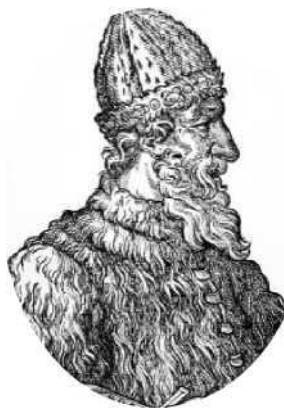
Великий князь Иван III

До XVIII века чиновники на Руси жили благодаря так называемым «кормлениям», то есть, при отсутствии оклада за исправление должности, разрешению на подношения от заинтересованных в их деятельности лиц. Одаривали их не только деньгами, но и «натурой» — мясом, рыбой, пирогами и пр., что было делом обыкновенным.