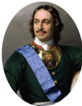
Император Петр I

Сообщениями «о похищении казны» первоначально занималась тайная канцелярия во главе с графом П.А. Толстым. И работала она на совесть. Но были и такие дворяне и чиновники, которые к проблеме мздоимства относились гораздо терпимее. По рассказам современников, однажды в Сенате Петр пригрозил издать указ, по которому всякий, кто украдет у казны сумму, на которую можно купить веревку, будет повешен. Генерал-прокурор Ягужинский на это заметил: «Неужели вы хотите остаться императором без служителей и подданных? Мы все ворует — с тем только различием, что один больше и приметнее, чем другой».