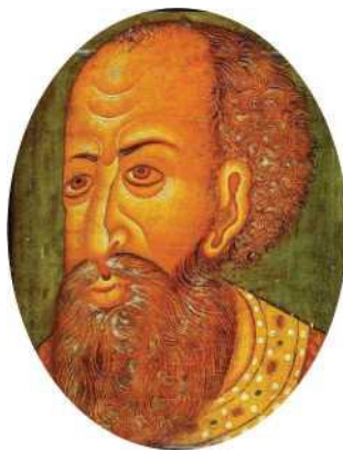
Царь Иван IV Грозный