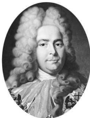
Генерал-прокурор Павел Иванович Ягужинский