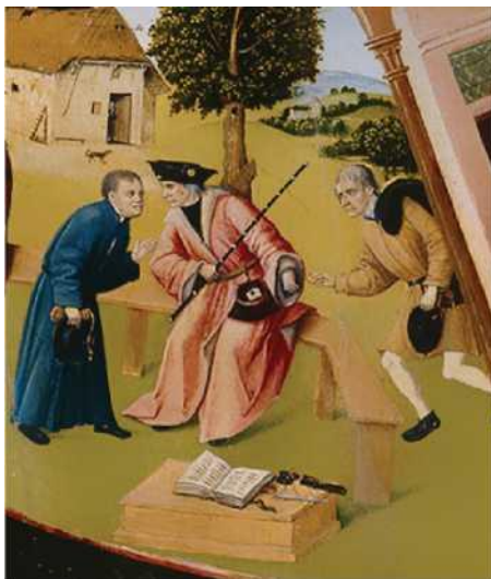
Фрагмент «Алчность» картины Иеронима Босха «Семь смертных грехов»

Рассматривая участников коррупции на примере взяточничества, стоит отметить, что в коррупционном процессе всегда участвуют две стороны. Одна сторона — это взяточполучатель (подкупаемый). Вторая сторона — это взяточдатель (осуществляющий подкуп). Также в процессе может участвовать и третья сторона — посредник.